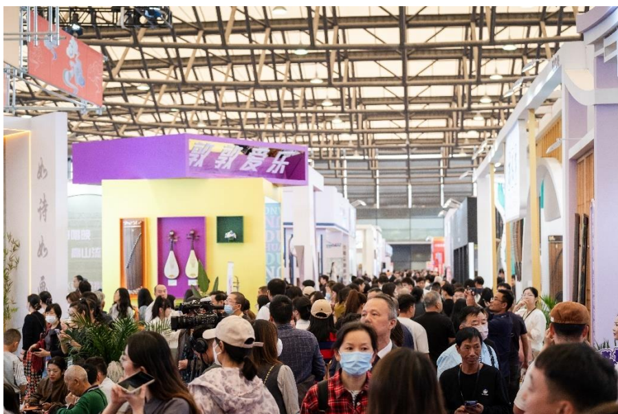
2023 年 Music China 展會觀眾人數位居展會二十載以來第二高

上海，2024 年 6 月。繼去年創下 122,000 人次的觀展記錄後，今年中國（上海）國際樂器展覽會（Music China）展覽面積將擴容至 150,000 平方米。今年第 21 屆 Music China 將於 10 月 10 至 13 日在上海新國際博覽中心舉辦，本屆展會備受業界期待，預計將吸引 2,000 家展商踴躍加入。此外，展會新增 N1 號館專門展示聲音錄制設備、電子與電聲樂器板塊。這個全新打造的專業聲音展館將為展商提供展示現場演奏與體驗原聲音效的舞台，為觀眾提供沉浸式聲音魅力之旅。為了保證觀展更佳體驗與有序環境，展商將配備耳機和隔音設備。